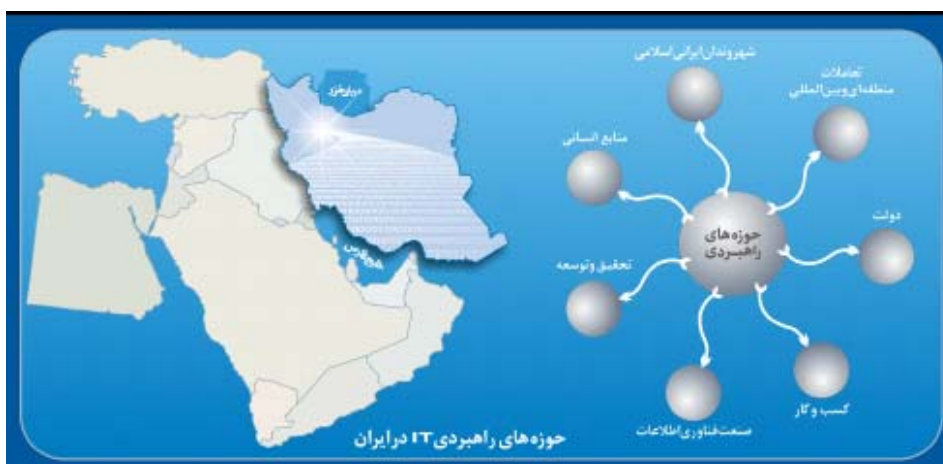
شکل ۲ - حوزه‌های هفتگانه راهبردی فناوری اطلاعات کشور

"جامعه و شهروندان"، "توسعه منابع انسانی باکیفیت"، "دولت و شیوه مدیریت عمومی و ارائه خدمات و سرویس‌های مورد نیاز و به‌روز در جامعه"، "تحقیق و پژوهش و نوآوری فناوری"، "توسعه صنعت فناوری اطلاعات" و "کسب‌وکارهای مبتنی بر فناوری اطلاعات" و "چگونگی تعامل محیط ملی و فراملی با شبکه‌های جهانی اینترنت، کشورها، بنگاه‌ها و بازارها".